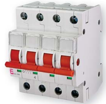
SV 463 ..4125