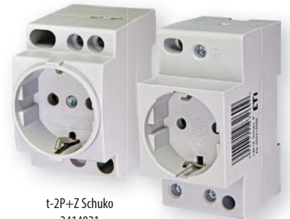
t-2P+Z Schuko 2414021