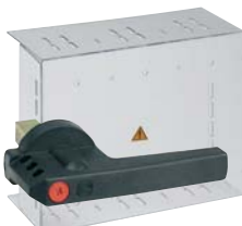
RO LAF3, RO LAF4, RO LAF5