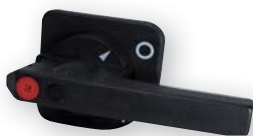
ROD LA3,4 ROD LA5