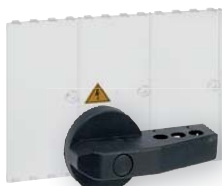
RO LA1, RO LA2